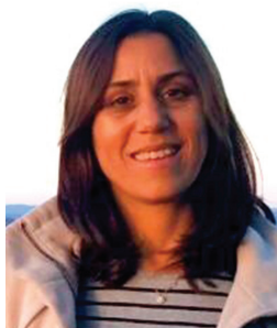
Asna El Achrafi Vicepresidencia